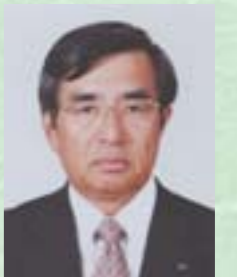
豊田通商健康保険組合