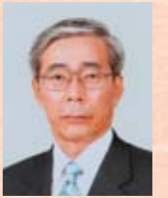
豊田通商健康保険組合