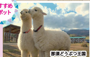
那須どうぶつ王国