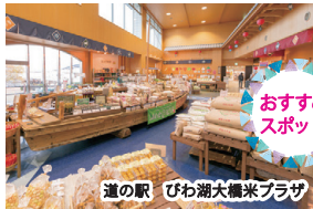
道の駅 びわ湖大橋米プラザ

【道の駅 びわ湖大橋米プラザ】琵琶湖と橋の眺望が抜群のロケーションに位置する道の駅。野菜や米をはじめとした地元生産者の農産品・加工品が豊富に揃います。(ホテルより車で約10分)