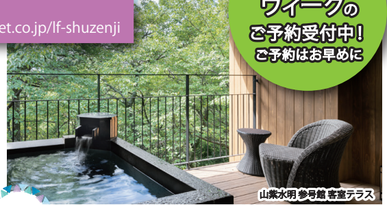
山紫水明 参考館 客室テラス

別荘のようなプライベート感あふれる温泉露天風呂付湯宿「山紫水明」で寛ぎ、夕食【雅コース】・朝食が付いたスタンダードプラン。修善寺温泉のやわらかな湯に身を任せ、癒しと安らぎに満ちる時をお過ごしください。 ※お部屋タイプは「富士山側」「天城山側」がございます。