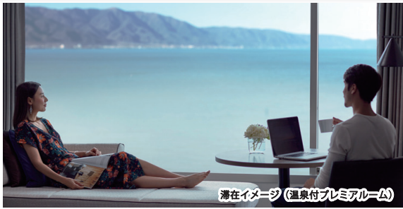
滞在イメージ (温泉付プレミアムルーム)