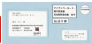
▲有効期限通知書の封筒